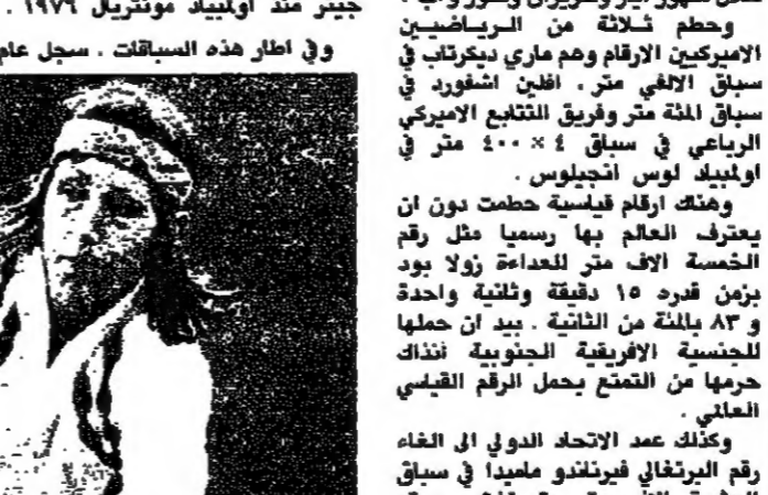
جيتير منذ اولى ايامه مونتريل ١٩٧٦